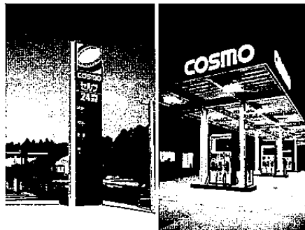
●サインボール (左) とシャープ製のキャンピーサイン (右)