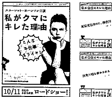
●グランプリ作品・「私がクマにキレた理由」(わけ)